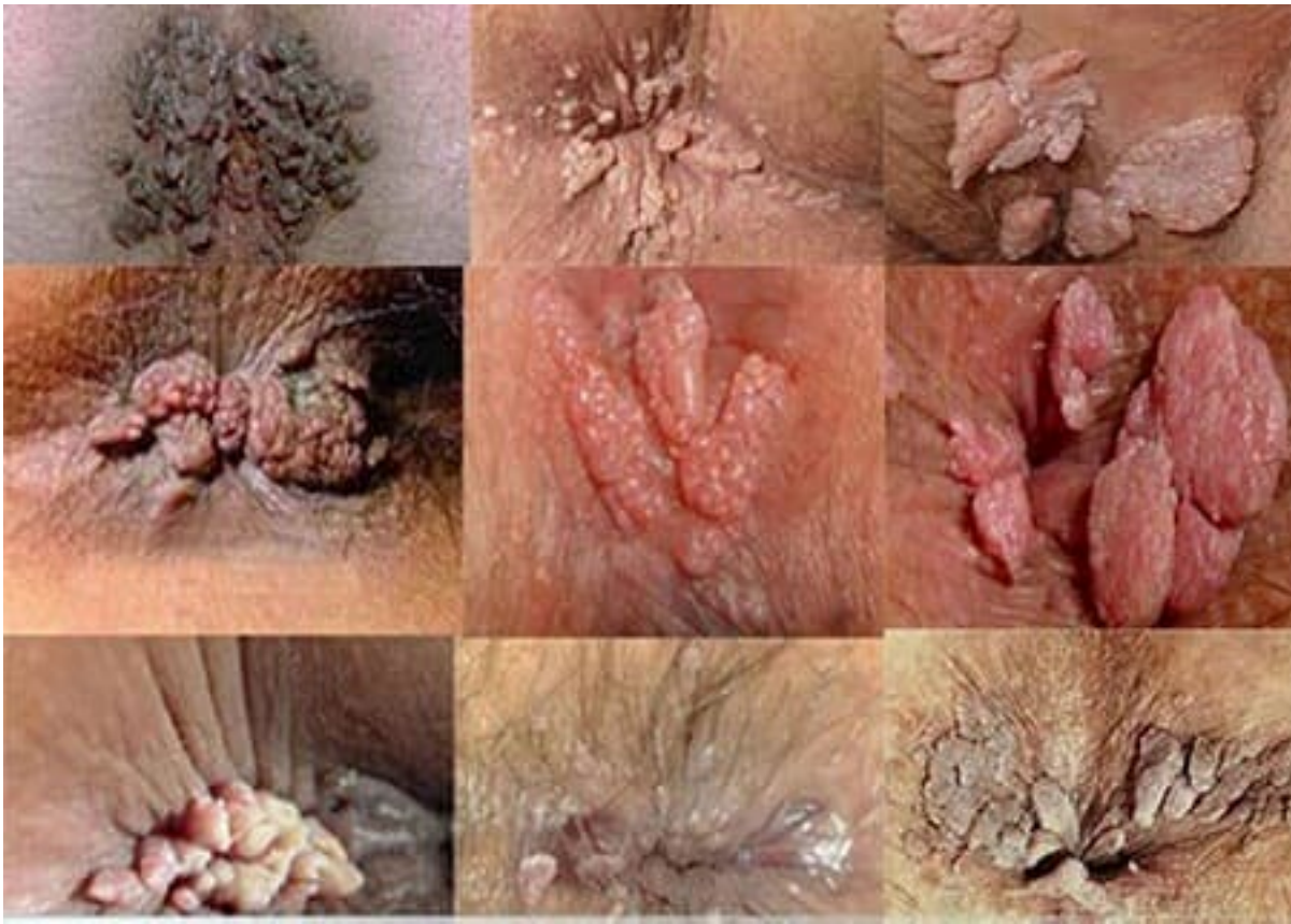
Biểu hiện bệnh lý trĩ máu gà ở vùng hậu môn