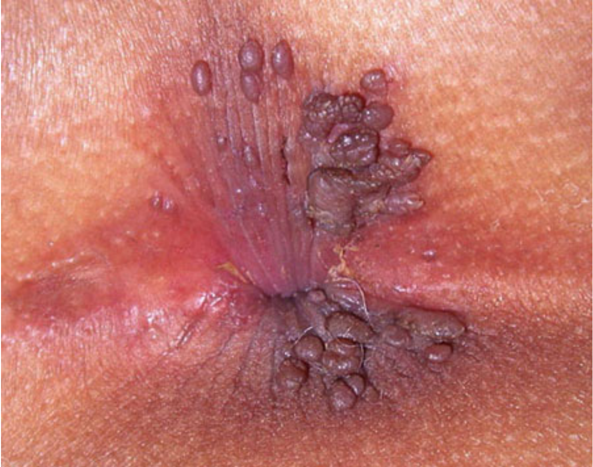
Hình ảnh bệnh sùi mào gà ở hậu môn

cũng như xung quanh khu vực ở vùng hậu môn.