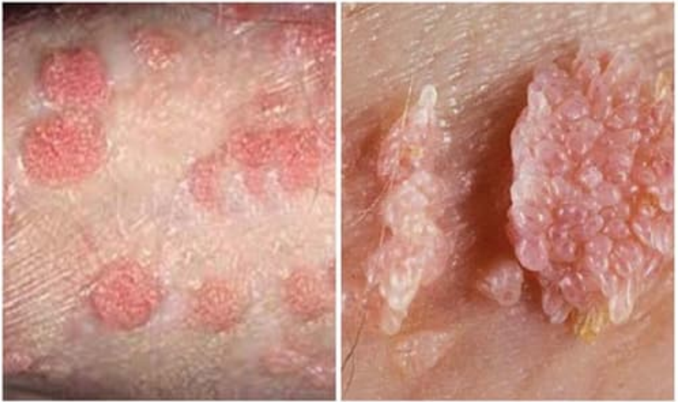
Hình ảnh bệnh lý sùi mào gà tại nam giới và nữ giới