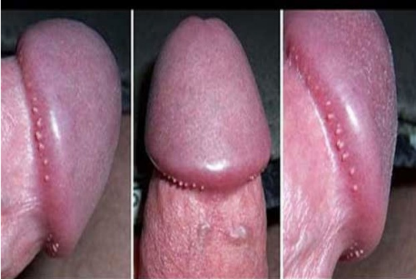
hình ảnh bệnh lý sùi mào gà ở rãnh lớp da bọc dương vật

Đặc biệt, nếu như không phát hiện cũng như điều trị mau chóng, các nốt bệnh sùi sẽ lan rộng đến nhiều bộ phận khác nhau của cơ thể. có thể xâm nhập vào lỗ sáo gây nên viêm nhiễm miệng sáo, tắc ống đưa tinh, viêm tuyến tiền liệt, thậm chí là