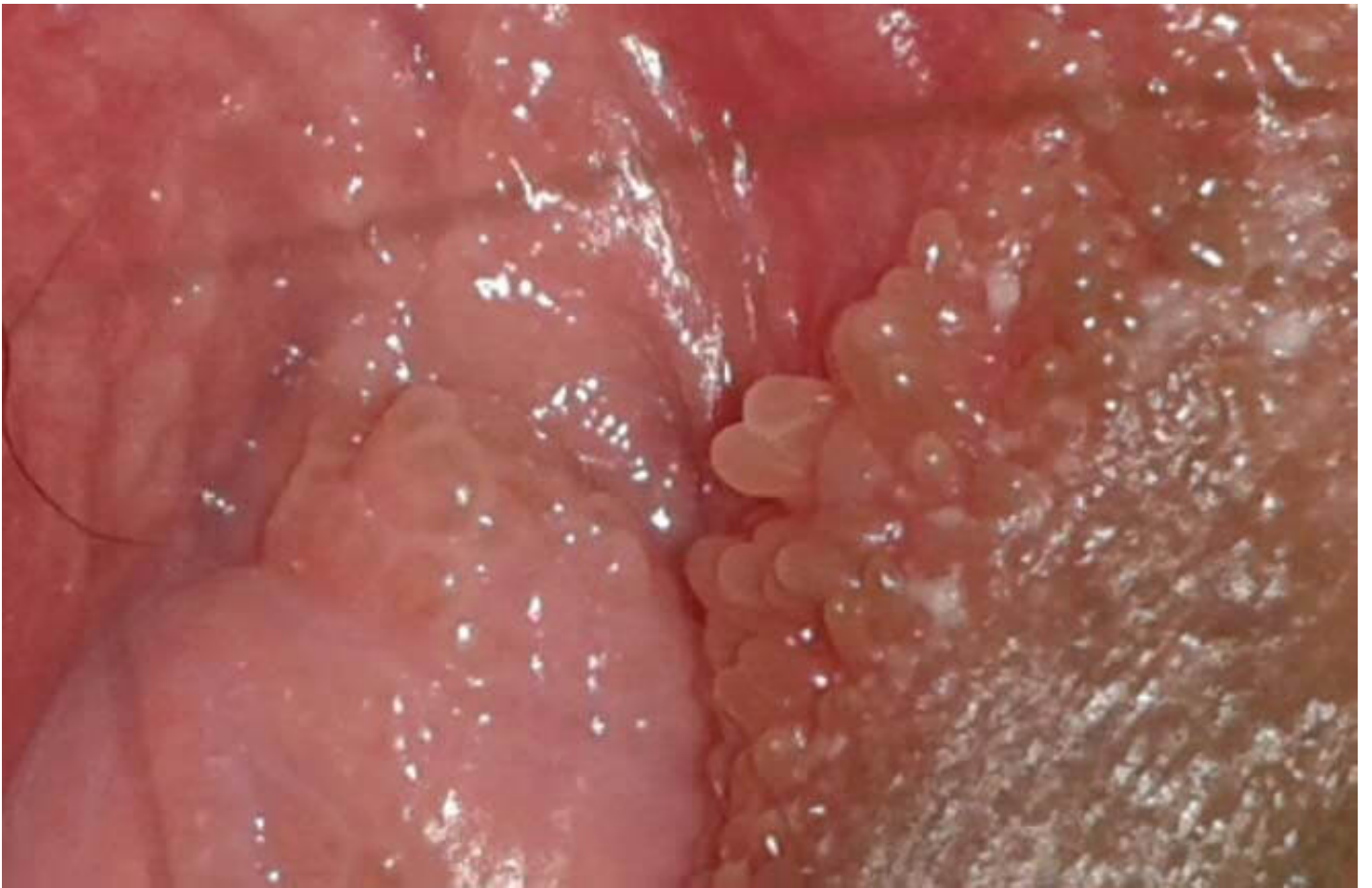
Sùi mào gà tại vùng kín

Bệnh lý sùi mào gà ở nữ giới nên trị liệu sớm, nếu như không bệnh sẽ gây khá nhiều tác hại. cụ thể như làm bí lỗ miệng sáo, vùng kín, cổ tử cung, gây nên ảnh hưởng đến khả năng thụ thai, sinh sản, ... Thậm chí ung thư vùng kín, cổ tử cung.