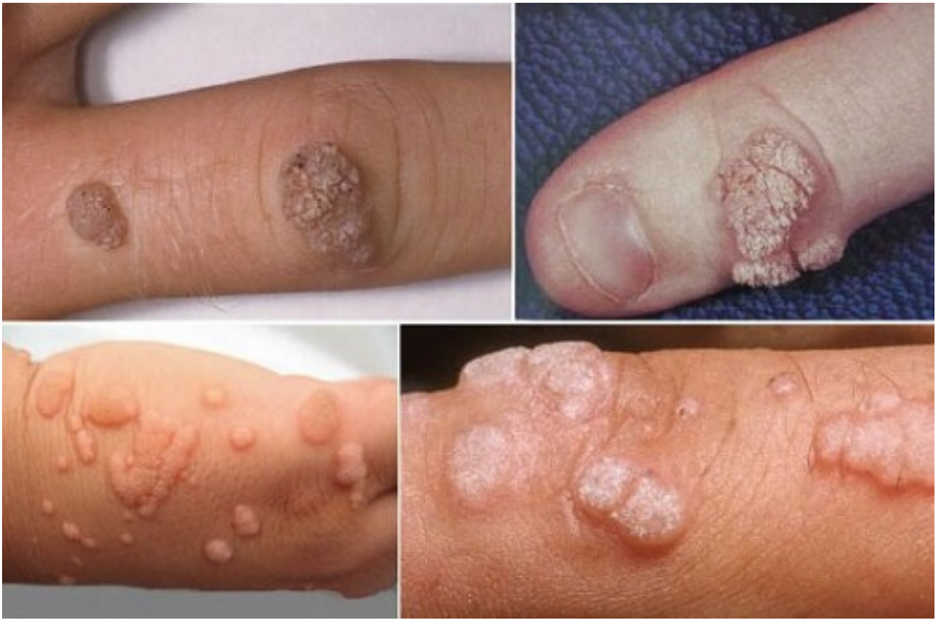
Hình ảnh sùi mào gà tại chân tay

Đặc trưng của chúng đều là một số nốt u nhú sần bệnh lý sùi, tập trung thành từng cụm. những bạn nên chú ý nếu gặp phải những biểu hiện này để thăm khám sớm, sớm.