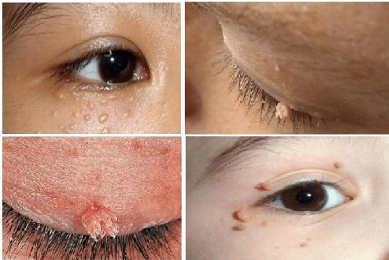
Hình ảnh sùi mào gà tại mắt

Bình Thường, hình ảnh bệnh lý sùi mào gà tại mắt thường tạo ra ở xung quanh ở tại vùng mắt, thậm chí là tại dưới bờ mi, bên trong mắt. Nó sẽ khiến cho người bị bệnh luôn cảm thấy rằng không thoải mái, tầm nhìn mắc cản trở, thị lực yếu dần. Điều