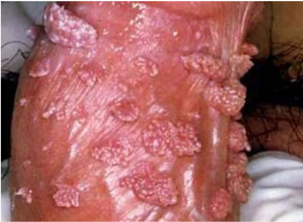
Một số nốt sùi mào gà tại thân dương vật