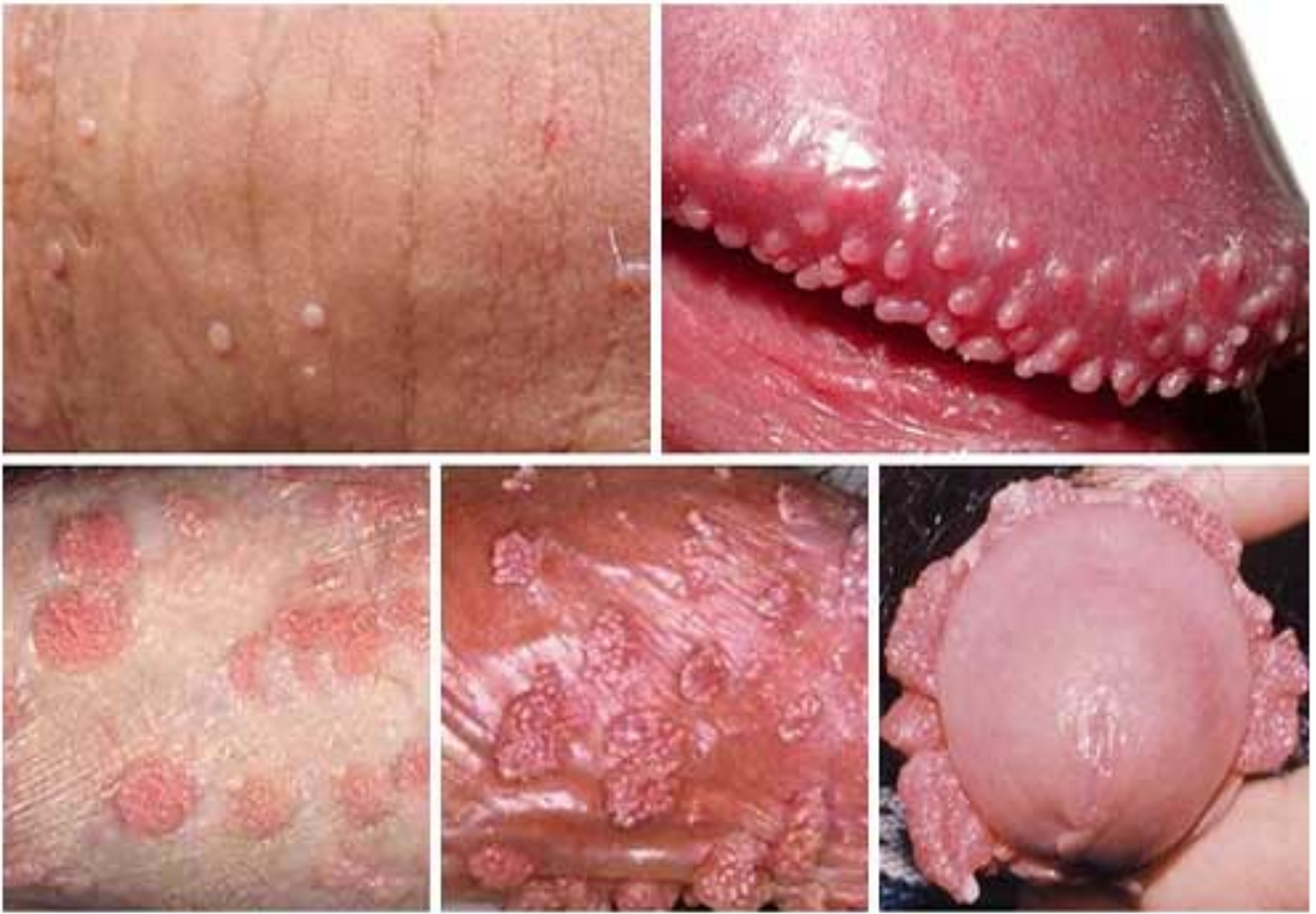
Hình ảnh sùi mào gà tại cánh mày râu