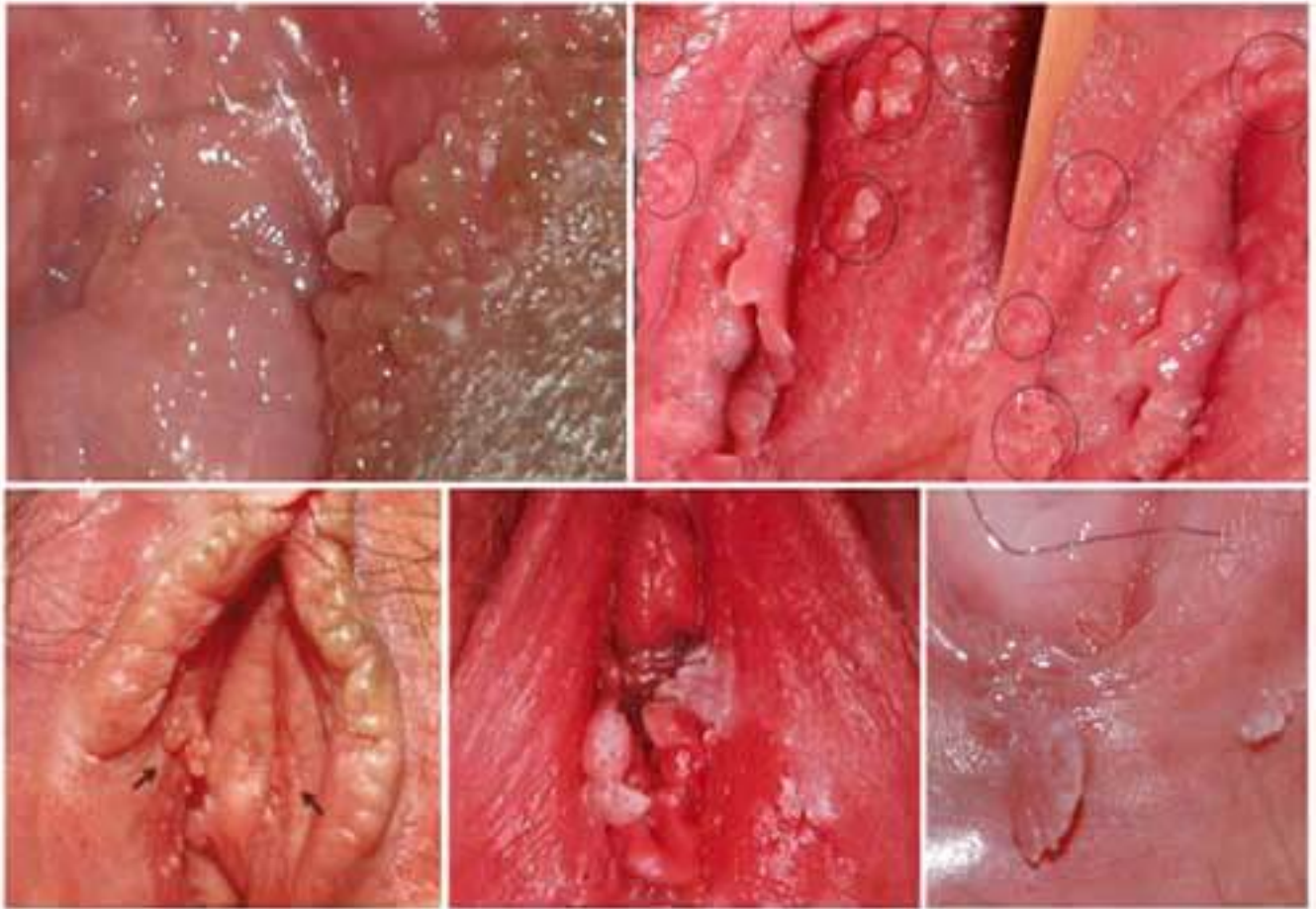
Hình ảnh bệnh sùi mào gà tại nữ

thể gây ra tình hình suy giảm ham muốn dục tình.