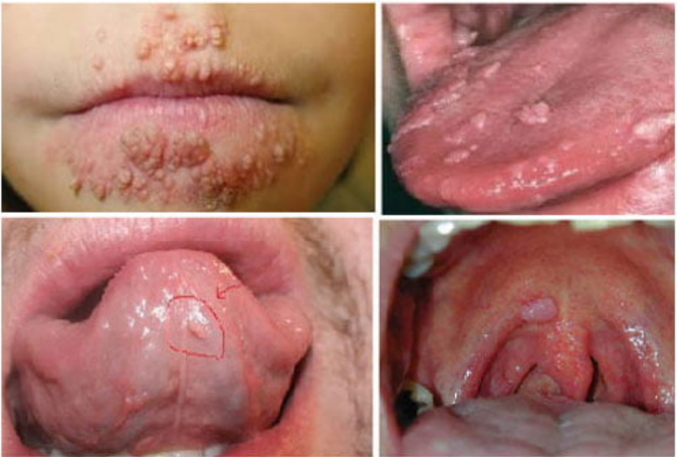
Hình ảnh bệnh sùi mào gà tại miệng, lưỡi, vòm họng

của các đối tượng có hình ảnh sùi mào gà tại miệng. ngoài ra vi rus HPV còn có khả năng lây truyền sang tại vùng miệng lúc bạn có hành động hôn sâu hoặc dùng chung các đồ dùng vệ sinh răng miệng với người bị mắc bệnh.