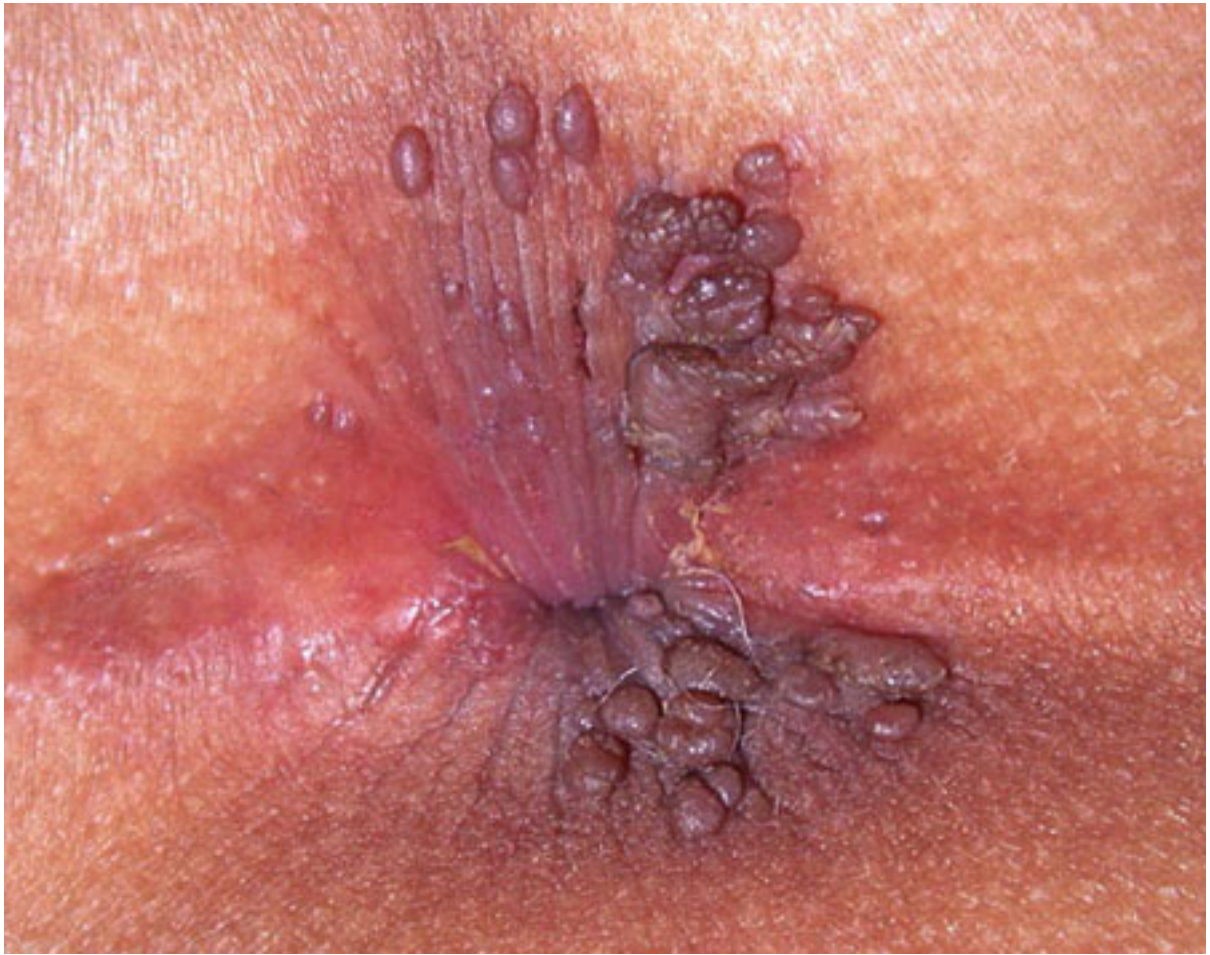
Hình ảnh sùi mào gà vùng hậu môn