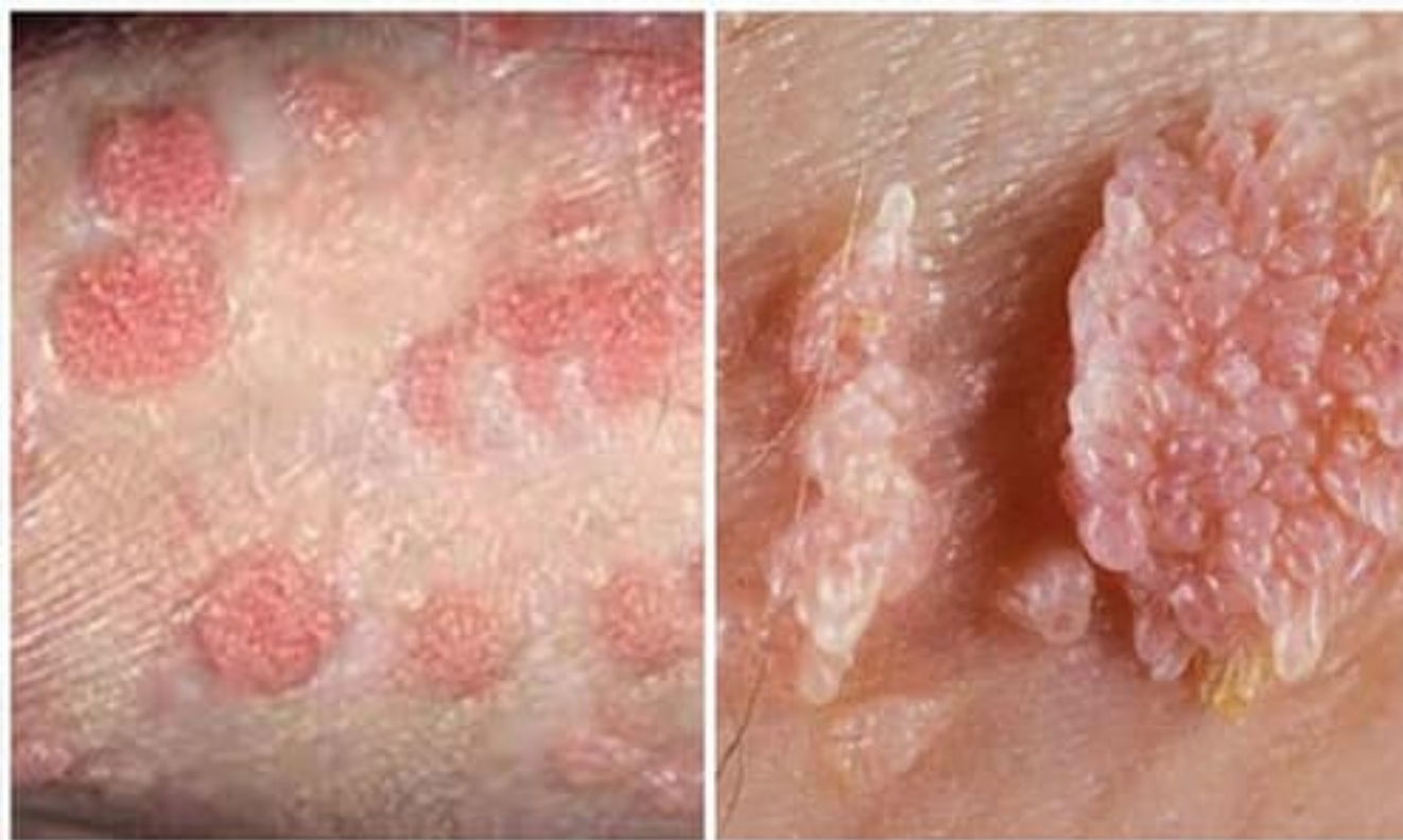
Hình ảnh bệnh sùi mào gà tại nam và nữ